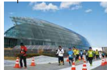
アクアマリンパーク 環境水族館「アクアマリンふくしま」や、いわき市観光物産センター「いわき・ら・ミュウ」など、海のまち・いわきを代表する観光スポット。表彰式やおもてなしブースの会場でもあります。