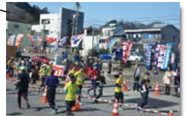
江名港 いわきサンシャインマラソンといえば！地元、江名地区の方々の熱烈な応援ポイント！