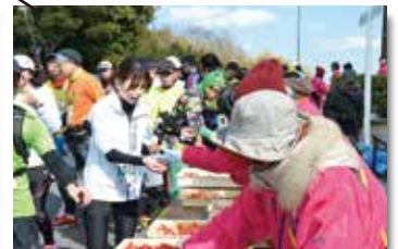
マリインタワー下 地元の食材を振る舞う「特産物エイド」！いちご、トマトなどを提供します！

この他にも催しがあり、ランナーのみなさんをお迎えいたします。※催しの内容については変更になることがあります。