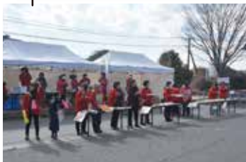
日産いわき工場付近 レース後半、皆さんの背中を後押しします！