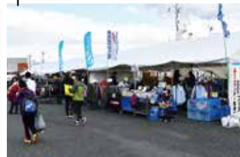
ゴール会場 ゴール会場では、ランナーへは恒例の振る舞い鍋！他にも地元物産展、スポーツ用品グッズ販売、マッサージブースなどがあります。