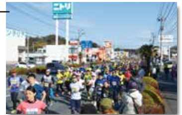
鹿島街道 鹿島地区のみなさんによる応援ポイント！