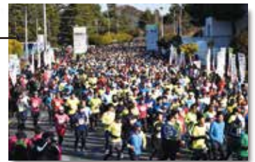
いわき陸上競技場 マラソンスタート会場